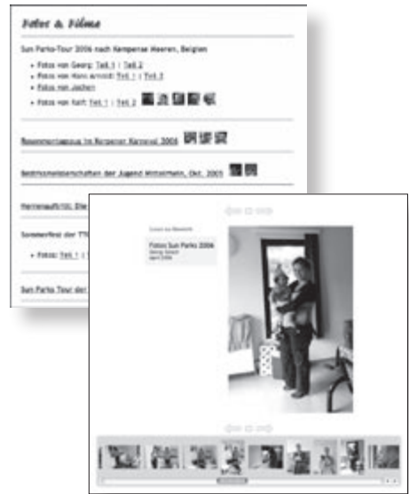
Die Foto-Seite mit Beispiel aus den Sun Parks