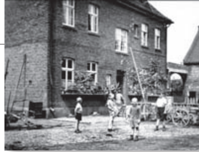
Hof Fuhswinkel / Reinirkens, um 1930