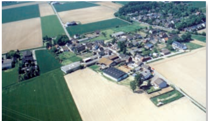
Langenich im Jahr 1995 (Familie Fischenich)