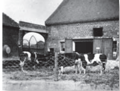
Hof Fuhswinkel / Reinirkens, um 1930 (Familie Reinirkens)