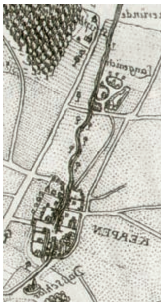
Ausschnitt aus der Karte des Kanonikers Stempel, 1587

Die Karte, die der Kanoniker Gerhard Stempel im Jahre 1587 von der Herrschaft Kerpen-Lommersum in Kupfer stach, zeigt den Ort auf halbem Wege zwischen Kerpen und Bergerhausen südlich des Neffelbaches gelegen. An Gebäuden erkennt man lediglich etwa neun Wohnhäuser, von denen mindestens drei bis vier wohl größeren Höfen zugeordnet werden können. Es scheint damals zwei bis drei Wegezugänge zum Bach gegeben zu haben, einer davon bot wohl die Möglichkeit zum Übergang, so dass trockenen Fußes »der wech nach Colln« bzw. »...nach Düren« zu erreichen war. Neben der Einmündung des Anbindungsweges in die Köln-Dürener-Land-