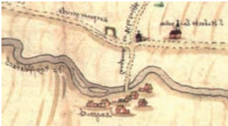
Ausschnitt aus einer um 1650 gefertigten Karte

Diese Karte stammt aus dem 17. Jahrhundert und gibt die Gegend zwischen Kerpen und Blatzheim wieder. Das oben bereits erwähnte Kreuz steht in dieser Zeichnung nördlich der »Landstraß von Düren auff Collen«, aber wieder an der Einmündung des Verbindungsweges von Langenich zur Landstraße. Dieser Weg führt nun weiter zum »St. Hubertus Busch« und wird »Langenacher Vieh-Trieff« genannt. Interessanterweise heißt der Ort – aus fünf Häusern bestehend – Langenich .