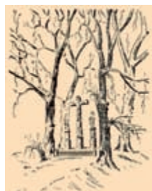
„An den drei Bildern“, Hermann Josef Baum, 1951 (Stadarchiv Kerpen)

ICH: STEHE: IN GOTTES. HAND GOTT. BEHÜTE MICH VOR FEWR UND BRAND DIE. INWOHNER VOR SÜND UND SCHAND AO 1716