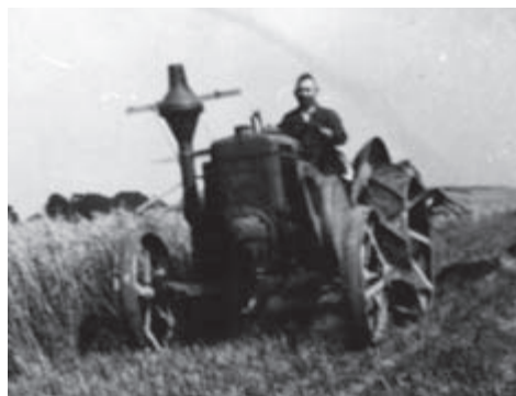
Feldbestellung, um 1940