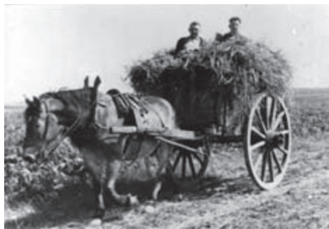
Feldarbeiten, um 1940 (Familie Reinirkens)