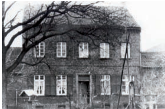
Alter Hof der Familie Fischenich, um 1940 (Familie Fischenich)

Fischenich ist das erste Mitglied der Familie in Langenich. Nachforschungen ergaben, dass weitere und frühere Familienangehörige in Blatzheim bzw. Bergerhausen lebten.