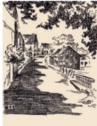
Blick in die Lindenstraße in Langenich, 1952, Hermann Josef Baum (Privatbesitz)

Im Jahre 1222 wurde das Verzeichnis unter Abt Caesarius neu abgeschrieben und kommentiert. Zur Lage des Besitzes wird dort aufgeführt: »Langenaccher non multum distat a Kerpene juxta Coloniam«, Langenich (liegt) nicht weit entfernt von Kerpen bei Köln . Der Kommentar gibt auch Auskunft über die Größe der Besitzungen. Außer ausgedehnten Ackerflächen wurden Wiesen – zur Weide und zur Heugewinnung – und Wald – zur Schweinemast – bewirtschaftet, zudem war eine eigene Mühle vorhanden.